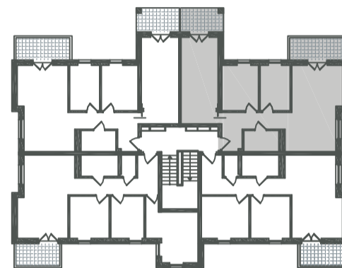
USYTUOWANIE LOKALU W BUDYNKU