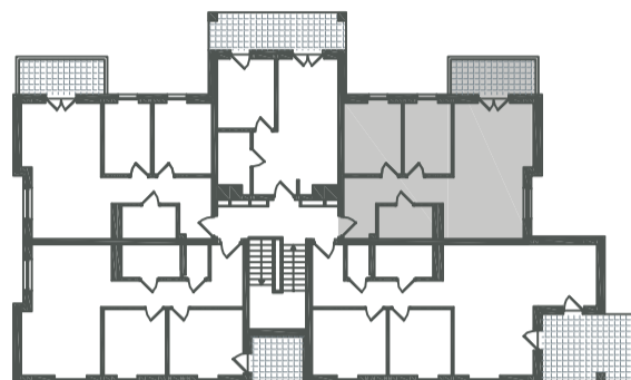
USYTUOWANIE LOKALU W BUDYNKU